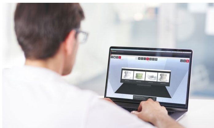
SIMPLEX sliceware с предустановками для ортодонтии