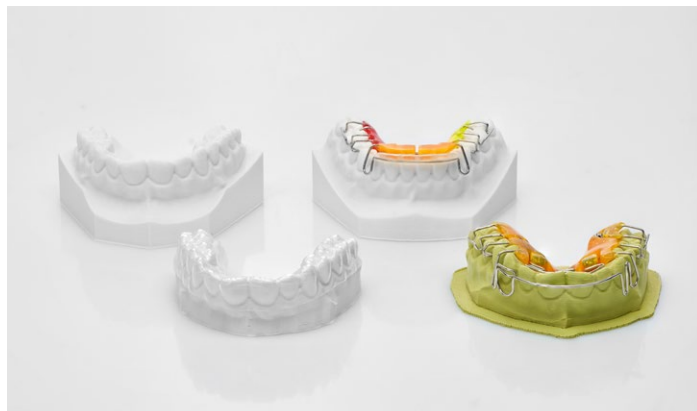
Предназначено для изготовления моделей в области ортодонтии