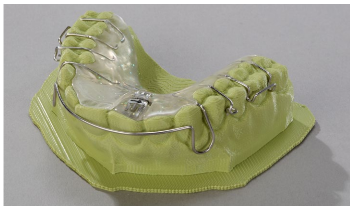
Без какой-либо доработки можно продолжить работу обычным образом