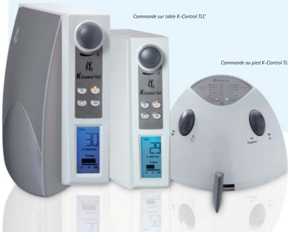
Commande au pied K-Control TLC