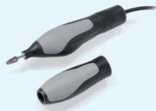
Le KaVo K-ERGOgrip est livré de série avec deux manchons de poignée

Le mécanisme à capacité de charges de l'unité d'entraînement du KaVo K-ERGOgrip est également conçu pour des conditions maximales. Le moteur CC sans collecteur propose, presque sans vibrations et sans contraintes sensibles, son potentiel de puissance au plus fort du couple moteur selon une plage de vitesses de rotation entre 1 000 et 50 000 t/min -1 .