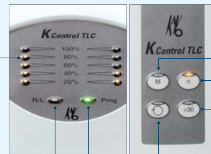
Affichage DEL pour la marche à gauche