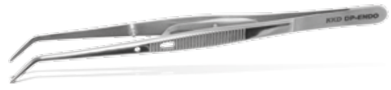
ENDO Pinzette L: 16 cm REF 12179 mit Schloss und eingearbeiteter Nut zur sicheren Fixierung von Gutta-percha-Spitzen und Endo-Nadeln./ Locking, horizontal and vertical grooves for secure holding of gutta-percha points and endodontic needles.