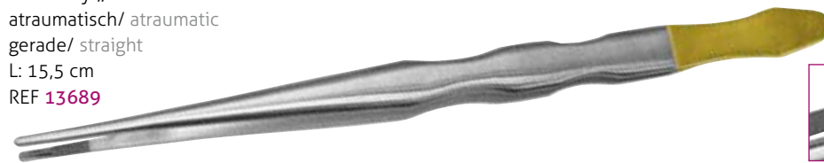
DeBakey „WAVE“ atraumatisch/ atraumatic gerade/ straight L: 15,5 cm REF 13689

Sicheres Halten von Schleimhautgewebe. Spezielle Zahnung verhindert eine Gewebe-Perforation. Safe grip of mucosal tissue. Special serration prevents perforation of tissues.