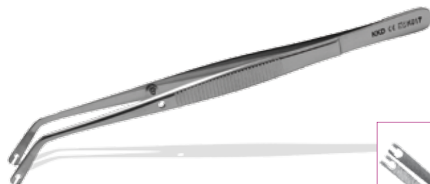
SP-20 Corn L: 15 cm