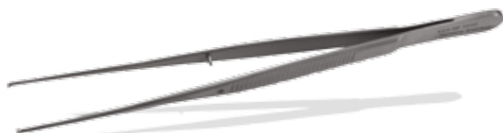
Semken-Taylor - gerade/ straight