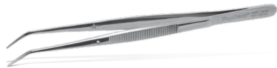
DP-17 College L: 15,5 cm REF 12184