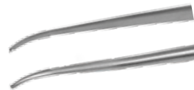
gebogen (45°)/ curved L: 18 cm TP33M18c REF 13706