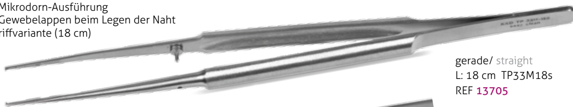
gerade/ straight L: 18 cm TP33M18s REF 13705